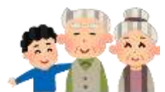
仙水園の皆様 本当にありがとうございました

10月30日(木)に、2年生が生活科「スマイルたつきゅうびん」という学習で、仙水園を訪問し、歌やダンスを披露したり、一緒にゲームなどをしたりして楽しい時間を過ごしました。準備のため、少し早めに到着したのですが、皆さんもう待っておられて、入ったとたんに「まあ～かわいい!」「ありがとう、ありがとう。」と声をかけてくださいました。2年生もお一人お一人に優しく話しかけながら、手を引いてゲームの場所にお連れしたり、「すごい!〇〇点です!」と盛り上げたりして頑張りました。一生懸命準備してきたゲームや贈り物、歌やダンスなどを心から喜んでいただいている様子に、2年生もとても嬉しそうでした。自分の存在が誰かを幸せな気持ちにするという体験は、きっと子供たちの心に残り続けることでしょう!